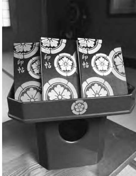
劔神社の御朱印帳。いずれも越前町織田の劔神社で