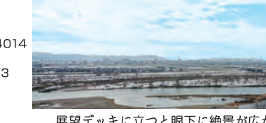
展望デッキに立つと眼下に絶景が広がる