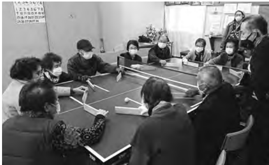
練習の様子。1チーム6人が木の板のようなラケットを使い、バスを回しながらネットの下を通過させ、相手チームと戦う

天候に関係なく楽しめるのも良いところ。雪が舞い散る取材日にも、転がると音がする専用の球を追って、白熱したゲームを繰り広げていた。