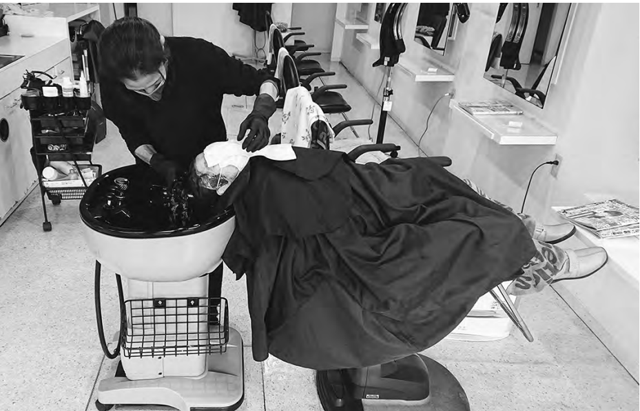
移動式シャンプー台を使った洗髪の様子。席ごとの床に専用の給水栓と排水パイプが組み込まれている=いずれも福井市文京6丁目のオフサイドで

すっきり晴れやかに変身を、という人も多いのでは。しかし、シニア世代になってくると美容室選びはなか