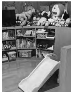
キッズスペースも完備

緒に入れる広い多目的トイレ。何より目を引くのが移動式のシャンプー台。シャンプーやカット、カラーリングなどのたびに椅子を移動する必要がない。まるで、自分専用のサロンでサービスを受けている感覚だ。