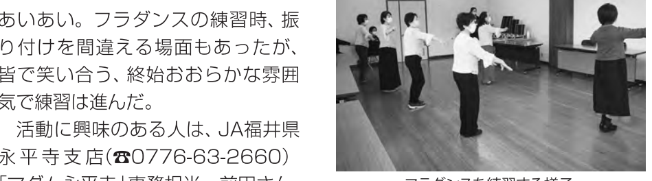
フラダンスを練習する様子