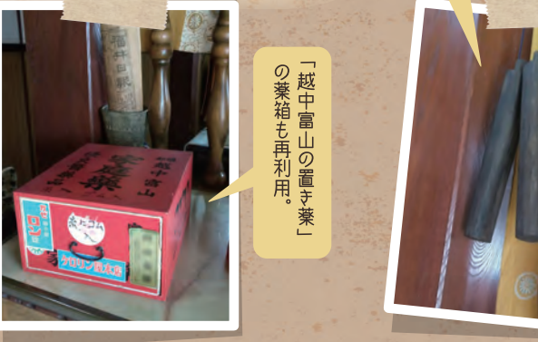
「越中富山の置き茶」の茶箱も再利用。