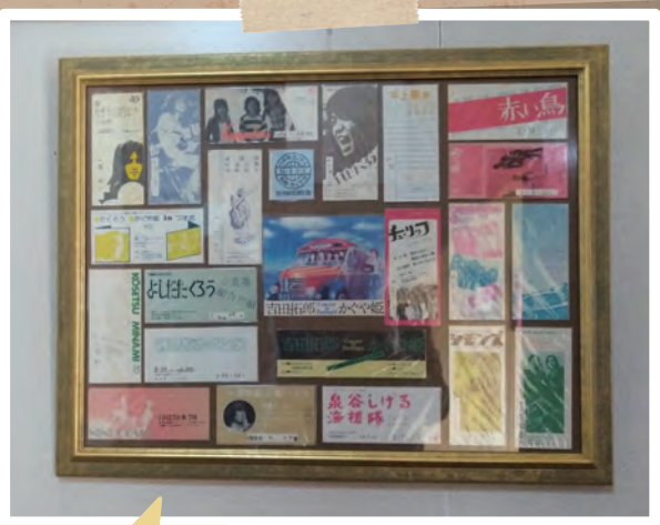
学生時代に楽しんだコンサートのチケットを額に入れて飾っています。