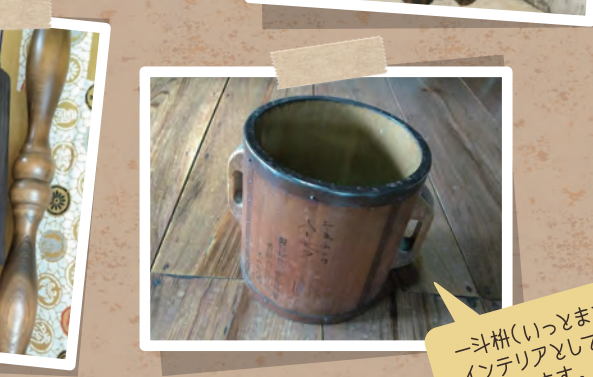
「斗帳(いっとうま) インテリアとして使っています。