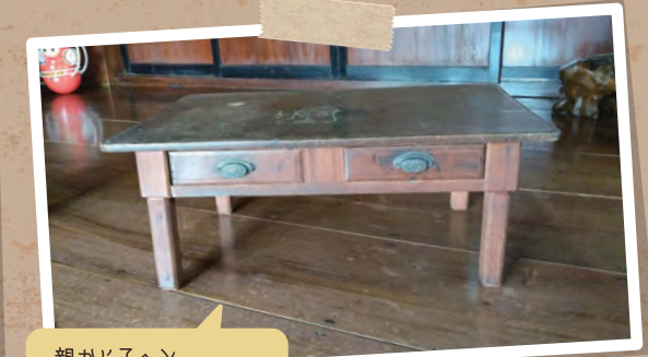
親から子へと受けつがれた学習机。