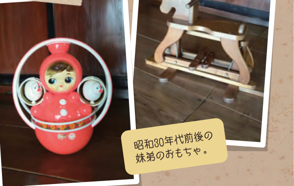
昭和30年代前後の妹弟のおもちゃ。