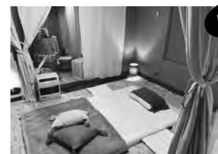
タイ古式マッサージの施術スペース。「半醒半睡」の状態を受けると効果も上がるそうなので、ウトウトしても大丈夫

お薦めはタイ古式マッサージなどのボディケアメニューとハーブテントの組み合わせ。体の外側と内側、