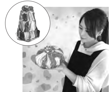
「肉ケーキ」(3~4人用、4,800円)、円内は3~5人用で6,480円)

日(月)、14日(火)に店頭で受け取る。価格は2,980円。このほか、誕生日やお祝いのサプライズプレゼントにお薦めな「肉ケーキ」も気になる。しゃぶしゃぶ用の牛・豚肉をケーキのようにデコレーションして販売している。持ち帰りはホールケーキを入れるような専用箱が付く。3~4人用なら4,800円、3~5人用は6,480円。2日前までに予約が必要だ。