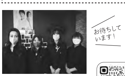
スタッフの皆さん