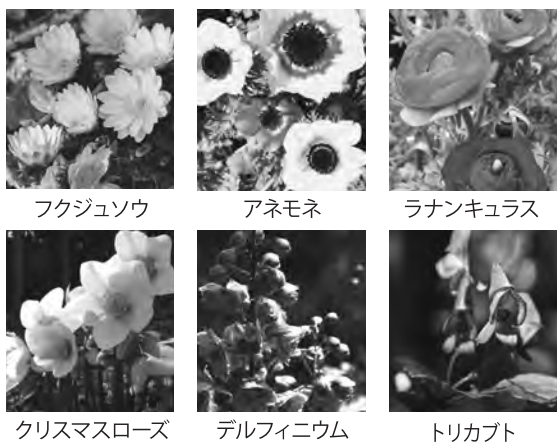
クリスマスローズ アネモネ ラナンキュラス クリスマスローズ デルフィニウム トリカブト

春本番を迎え、色とりどりの花たちが目を楽しませてくれています。フクジュソウ、アネモネ、ランキュラス、クリスマスローズ、デルフィニウム、…。園芸好きの人にはおなじみの花の名前ですね。これらはいずれもキンポウゲ科に属している花です。キンポウゲ科の植物は例外を除いてほとんど有毒。有毒植物として有名なトリカブトもキンポウゲ科です。毒の強さはトリカブトほどではないにしても、キンポウゲ科の植物の取り扱いには注意が必要です。皮膚が弱い人は、切り口に触れると皮膚炎などを発症する可能性があるため、お世話する際には手袋の装着を。また、花を飾った花瓶の水をペットが口にするのがないよう気を付けましょう。