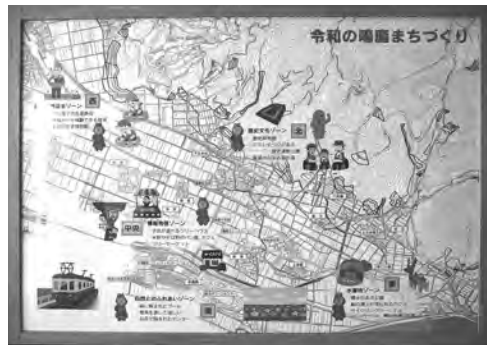
完成した「令和の鳴鹿まちづくり」パネル