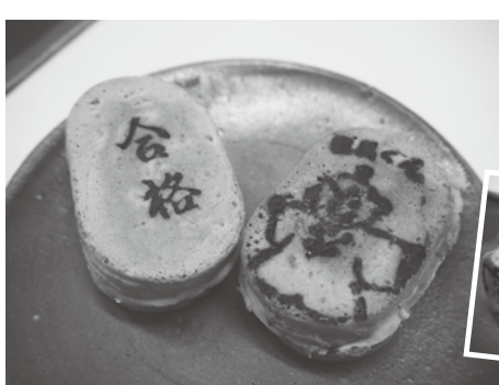
「合格まんじゅう」※「信長くん焼き」はともにお店の看板メニュー。「信長くん焼き」の中には丹波の黒豆がぎっしり

甘さ控えめに炊いたふくら小倉あん、白はトローリ濃厚なカスタードクリームが合格のめでたさを演出し「小倉あんもカスタードも両方食いたい!」という欲張りな心も満たしてくれる。受験シーズンには受験生や受験生のいる家族への手土産に引っぱりだこだそう。一年を通して販売しているの、検定やこそごという昇進試験のゲン担ぎにもイチ押しだ。また、劔神社にちなんだ「信長くん焼き」(120円)もはずせない。中には大きな粒が特長の丹波産の黒豆を甘く炊いたあんが入っている。黒豆をあんにした大判焼きは珍しく、福井県内で食べられるのはチャオだけとか。粒だった豆が控えめの甘さで炊かれ「あっさり、軽く食べられる」と子どもからシニア層まで、幅広い世代に人気の一品